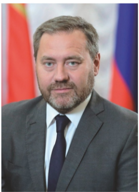
Председатель Законодательного Собрания Санкт-Петербурга БЕЛЬСКИЙ Александр Николаевич

Давайте вместе создадим уникальную фотоколлекцию, отражающую любовь к нашему округу!